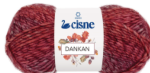
00602 Mescla Rosê/Vinho