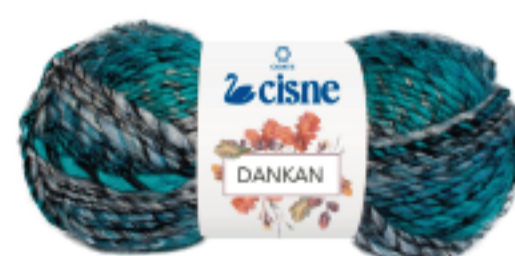
00960 Mescla Verde/Cinza