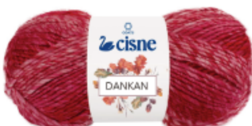
00803 Mescla Vermelho/Branco