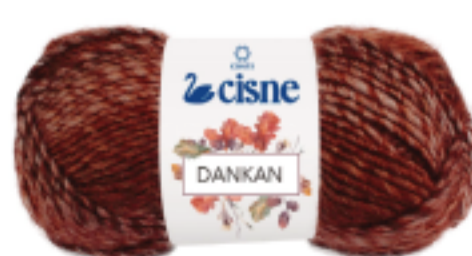
00930 Mescla Marrom