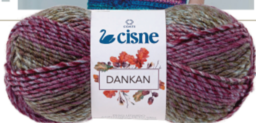
00570 Mescla Verde/Vinho/Lilás

Expressando nossa ampla aceitação de cores, as combinações do fio Cisne Dankan sugerem uma sede de libertação e um desejo de perceber nossa própria identidade. Combinações únicas de cores em um perfeito multicolorido. Ideal peças de vestuário, acessórios ou decoração. Trabalhe em tricô, crochê ou tear.