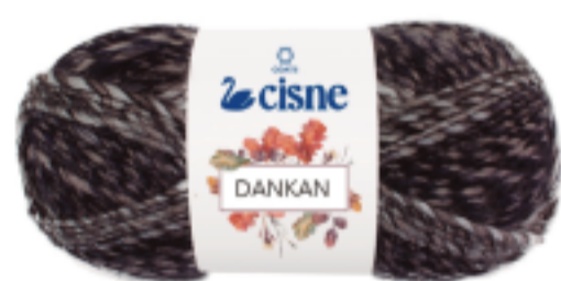
00200 Mescla Preto/Cinza

Cisne Dankan con efecto teñido te ofrece una paleta de colores que se armonizan entre sí en un perfecto multicolor, y lo mejor no tendrás que cambiar de hilo para lograr este bello efecto, ideal para crear prendas de vestir, accesorios, incluso para decoración. Este producto es recomendado para crochet, tejido y telar.