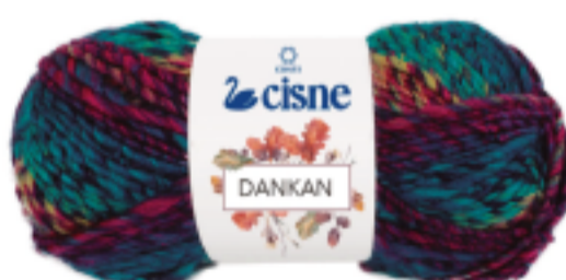
00560 Mescla Verde/Rosa